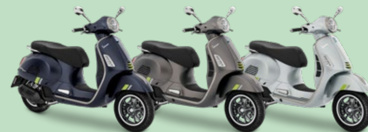
BLU ENERGICO OPACO